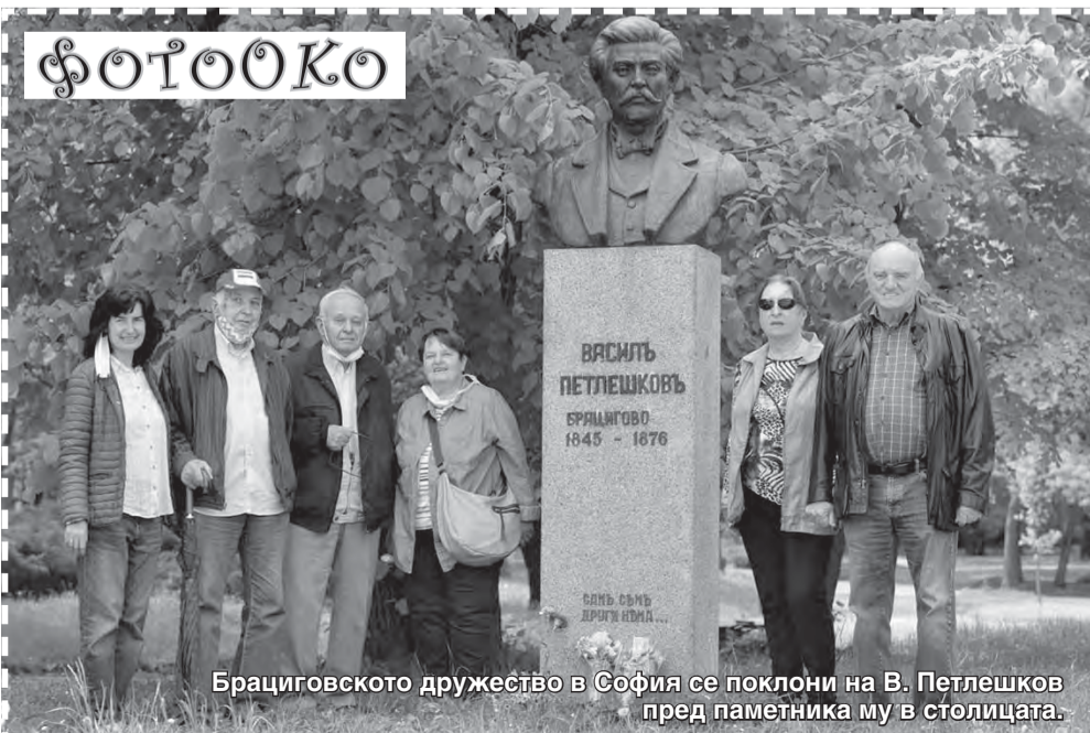
Брациговското дружество в София се поклони на В. Петleshkov пред паметника му в столицата.

Писмени становища могат да се предоставят в срок до 14 (четирнадесет) дни след датата на общественото обсъждане - до 14.07. 2021 г., на адрес: Община Брацигово, гр. Брацигово, ул. „Атанас Кабов“ № 6А.