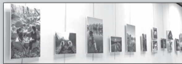
Фото и видео клуб към КСУДС – Брацигово, откри преди Великден поредната си изложба. Този път домакини на малките фотолюбители стана галерия „Георги Машев“ – Пазарджик.