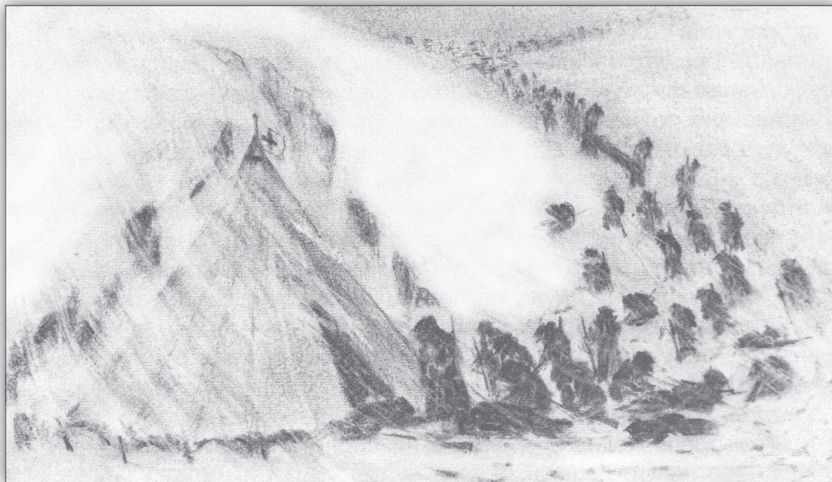
Медицинският пункт „Чагъра“ – рисунка на г-р Матакиев, лекарят на полка

Лютата зима смразявала и хората, и добитъка. При това българската армия не била достатъчно добре подготвена да воюва при сурови зимни условия. Командването не предвидило, че войната ще се проточи чак толкова дълго и при такива условия, та по тази причина не достигали топли дрехи, боту-