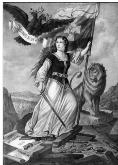
„Свободна България“, литография, популярна като творба на Георги Данчов-Зоографина, според някои неин автор е Хенрих Дембицки

По-късно вече осъзналата се българска нация ще започне да формира национални идеали, да се стреми към обединение на всички територии, в които живеят българи. Именно националното съзнание е причина да се случи Съединението, да се